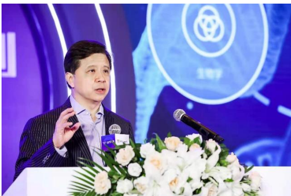
應對數位化轉型挑戰，跨界共創正當時