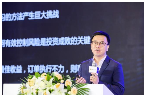
跨界共創 AI 的產業價值和科學價值